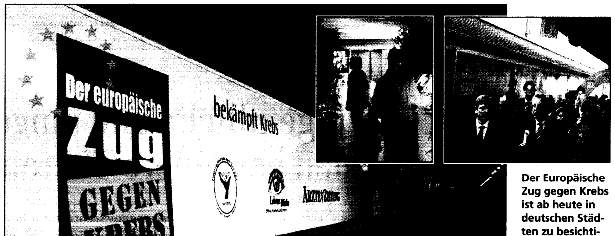
Der Europäische Zug gegen Krebs ist ab heute in deutschen Städten zu besichtigen.

Der Europäische Zug gegen Krebs steht unter dem Motto „Mehr Wissen bekämpft Krebs“. Ziel ist, Menschen die Angst vor der Krankheit zu nehmen und sie aufgeschlossen zu machen für die Vorsorge. Die Ausstellung ist so