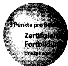
Jetzt 3-fach punkten ► Seite 483