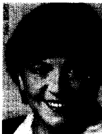
Ulla Schmidt, Bundesministerin für Gesundheit u. soziale Sicherung (SPD)

Weil diese Website Wichtiges über die Gesundheit von Kindern enthält.