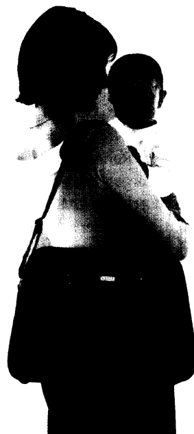
Neues für Alltag und Pflege finden Sie wieder auf unseren Produktseiten.