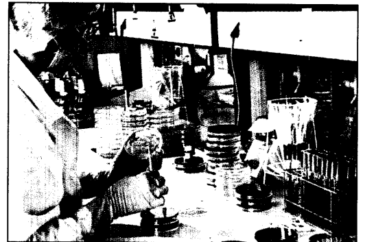
Analyse im Labor. Bei dem PCT-Test liegen die Resultate innerhalb einer Stunde vor.

Mit einer Sputumanalyse lassen sich zwar ebenfalls Bakterien nachweisen, ein negatives Ergebnis schließt aber eine bakterielle Infektion nicht aus. Anders bei dem Marker PCT. Das Protein erhöht sich nach