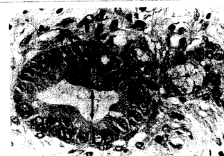
Gut differenziertes duktales Adenokarzinom des Pankreas.