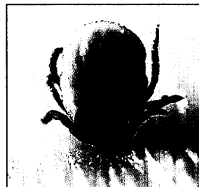
Diese adulte weibliche Zecke saugt bereits einige Zeit an ihrem Wirt.

Die Frühsommer-Meningoenzephalitis breitet sich in Deutschland weiter aus. Einen sicheren Schutz vor der Infektion bietet nur die Impfung. Geimpft werden sollten