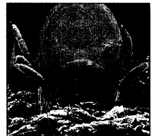
Wenn Zecken Blut saugen, nehmen sie das 200fache ihres Körpergewichts zu.