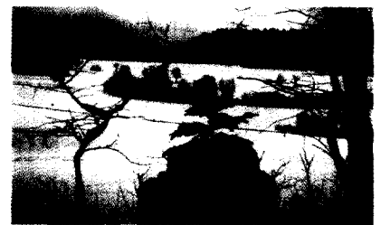
Winter: Blase - Niere