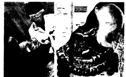
Zähne und der Magen