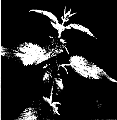
Brennnessel bei Rheuma