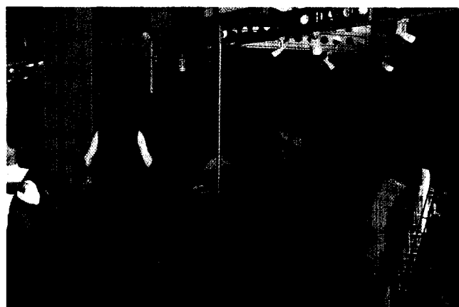
Hier gab es viel zu sehen, viele zu treffen und noch mehr zu erfahren.