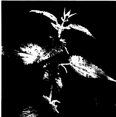
Brennnessel bei Rheuma