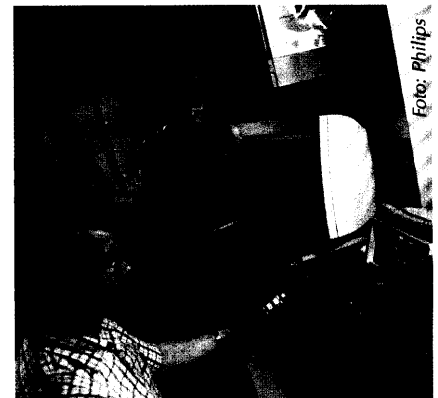
Philips-Forscher in Aachen haben ein Online-Diagnose- und Alarmierungssystem entwickelt, das direkt am Körper getragen wird.

Wiederaufbereitung nach wie vor ein heikles Thema 55