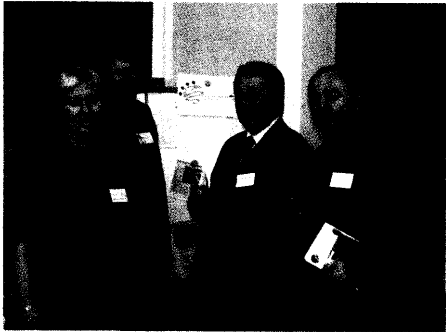
Am Stand der Landesärztekammer war während des Parlamentarischen Abends im Mainzer Landtag viel los. ▶ Seite 6