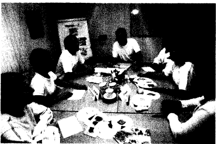
Qualitätsmanagement hilft, Praxisabläufe zu optimieren. Regelmäßige Analysen und Gespräche im Praxisteam gehören dazu. ▶ Seite 9