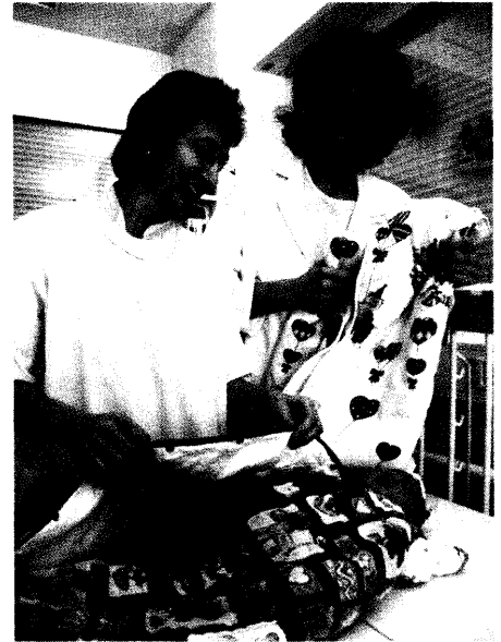
In der Universitäts-Kinderklinik Mainz gibt es in den Säuglingsbettchen keine Federbetten mehr, sondern Babyschlafsäcke. Der Grund: die Sicherheit der Säuglinge. Denn Babys im Schlafsack haben ein geringeres Risiko am plötzlichen Kindstod zu sterben als Babys, die mit Federbetten zugedeckt werden.