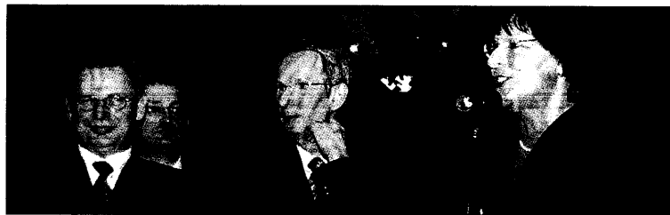
NEUJAHRSEMPFANG VON BÄK UND KBV 6