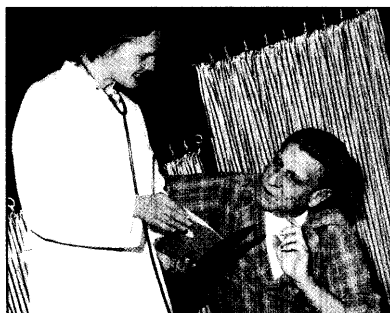
Die Theaterproduktion „Alarm im Darm“