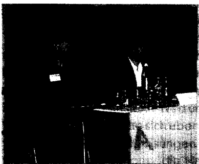
Theobald © Mauritz