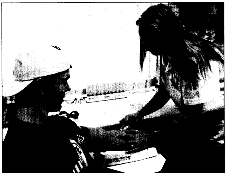
Vor dem Blutabnehmen hat so mancher Patient Angst. Gleichzeitiges Husten lenkt vom Nadelstich ab.

Der Deutsche Hausärzterverband hatte kürzlich ausgerechnet, daß nach dieser Methode bereits Praxen mit über 700 Scheinen enorme Probleme bekämen. Nach