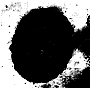
Spulwurm – Ei mit Larve.