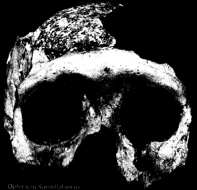
Opfer von Kannibalismus