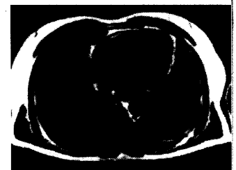
Kardiale transversale MRT-Aufnahme.