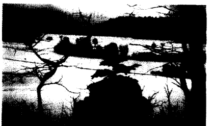
Winter: Blase - Niere