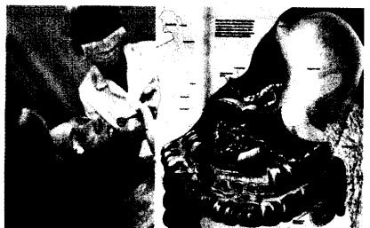
Zähne und der Magen