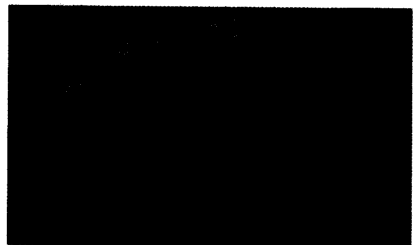
Psyche Beine machen