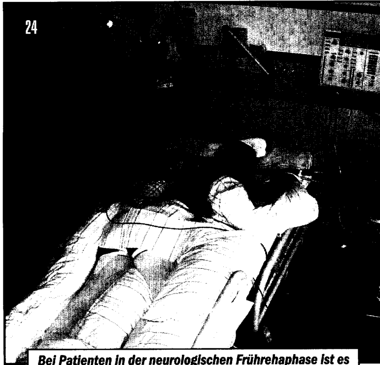
Bei Patienten in der neurologischen Frührehabphase ist es wichtig viele Informationen durch das Spüren zu vermitteln.