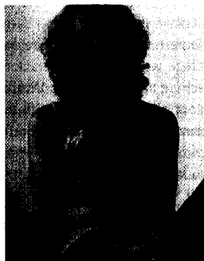
Seite 48 Beratung im Berliner Haus der Familie

MANUSKRIPTSCHLUSS FÜR DIE AUSGABE 2/04 DES FACHMAGAZINS ROTES KREUZ IST DER 16. JANUAR