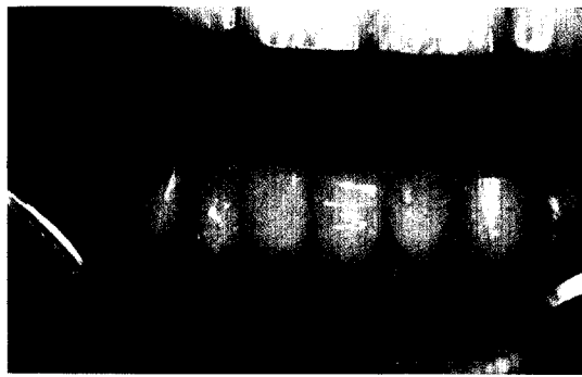
Die besonderen Charakteristika altersspezifischen Zahnersatzes stehen im Mittelpunkt des Beitrags von Ztm. Koinig. Ab Seite 73

Heinzel, I.: Herausforderung Zirkonoxid 63