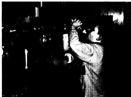
Kindliche Neugier kann lebensgefährlich werden. Putzmittel und Medikamente dürfen für Kinder daher nicht erreichbar sein. Doch etwa jeder zweite Notfall, den die Mainzer Giftinformationszentrale gemeldet bekommt, betrifft ein Kind. ► Seite 10