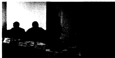
Den Kontakt und den Informationsaustausch mit den rheinland-pfälzischen Ärztinnen und Ärzten suchte immer wieder Gesundheitsministerin Malu Dreyer. So stand sie auch während der Frühjahrs-Vertreterversammlung der Landesärztekammer Rede und Antwort. Das Jahr 2003 setzte aber auch noch viele andere Akzente. ► Seite 14