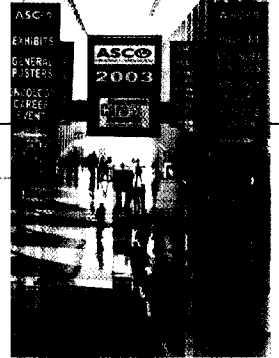
Der 39. ASCO-Jahreskongress lieferte eine Fülle neuer Studiendaten und praxisrelevante Erkenntnisse für die Therapie von Tumorkrankheiten.