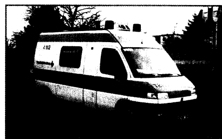
Hilfsfristenproblematik im Landkreis Groß-Gerau