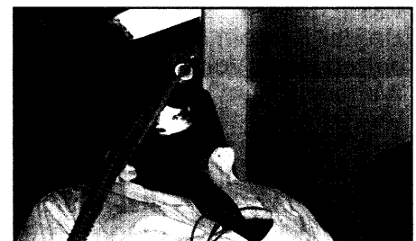
Alternative: Die noninvasive Beatmung