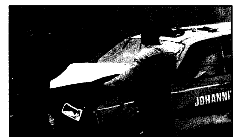
NEF-Unfall wurde von RTL verfilmt