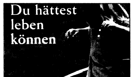
Fehlbehandlung mit Todesfolge: Aus der Sicht einer Mutter