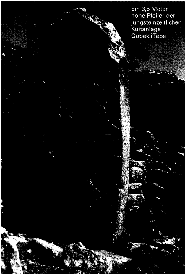
Ein 3,5 Meter hohe Pfeiler der jungsteinzeitlichen Kultanlage Göbekli Tepe

Meterhohe Steinpfeiler, Tierreliefs und Piktogramme – Göbekli Tepe, eine kürzlich entdeckte Kultanlage der Jungsteinzeit, gibt den Archäologen Rätsel auf.