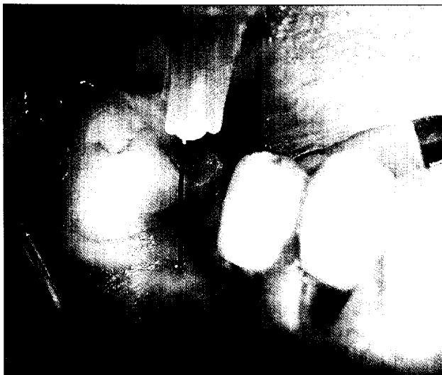
Neue Technologien in der Lokalanästhesie Seite 26

26 Neue Technologien in der Lokalanästhesie ZA Stefan Scherg