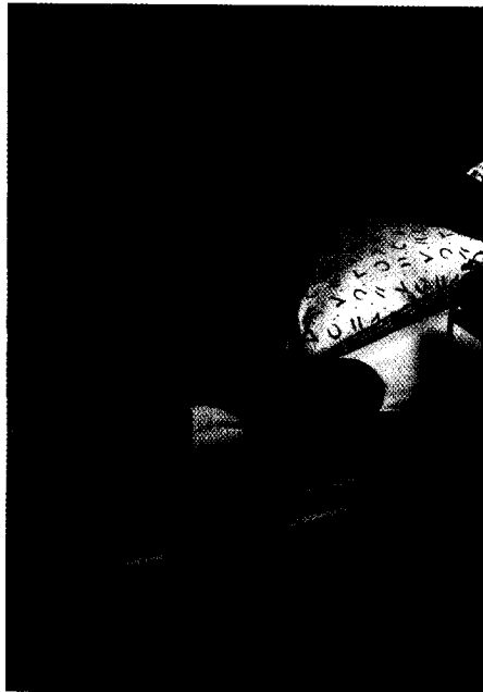
Reizdarm: Bei Dauerschmerz lohnt sich unter Umständen ein Therapieversuch mit einem Antidepressivum