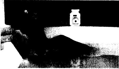
Entgiftung über Haut