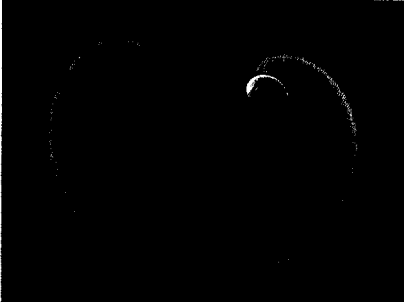
Physik des Lebens