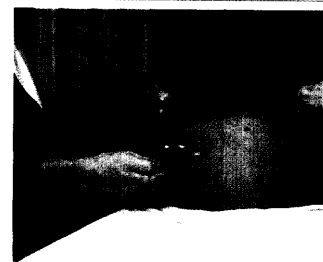
Nach Reanastomosierung einer Tubenligatur werden jüngere Frauen unter 35 Jahren leichter schwanger.