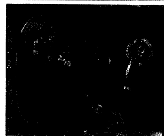
„Die Jungfrau mit dem Kinde“.