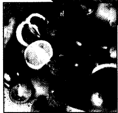
Umwelt und Krebs