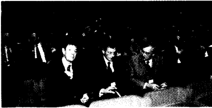
Punktsieg für den DAV. Der Europäische Gerichtshof hält das Verbot des Versandhandels mit rezeptpflichtigen Arzneimitteln für zulässig. Seite 8

Europäischer Gerichtshof: Versandverbot entspricht weitgehend EU-Recht 80 Prozent zu Gunsten des DAV / Kommentar