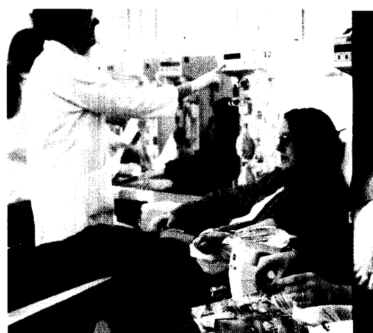
Blutplasma wird für die Herstellung lebensnotwendiger Medikamente benötigt, die für viele chronisch Kranke die einzige therapeutische Option darstellen. Täglich sind in Deutschland rund 5000 Plasmaspenden erforderlich, um den Bedarf zu decken. Seite 26