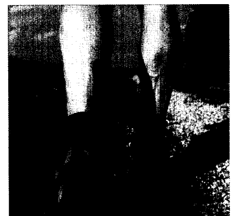
Achillessehnenruptur: Auch bei ambulanter Behandlung gute Prognose.