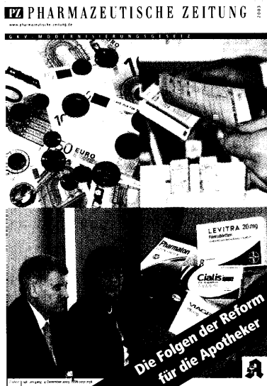
Dieser Ausgabe liegt eine Beilage zum GKV-Modernisierungsgesetz bei. Den gesamten Gesetzestext finden Sie in den Amtlichen Bekanntmachungen.

33 ABDA-Presseseminar: Apotheke 2004 – Modern und facettenreich