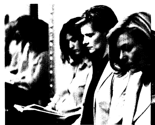
Weniger als die Hälfte der Patientinnen mit der Diagnose Ovarialkarzinom überlebt die nächsten fünf Jahre. In der Behandlung des Tumors konnten jetzt entscheidende Fortschritte erzielt werden. Eine innovative Wirkstoff-Kombination setzt einen neuen weltweiten Standard. Seite 26