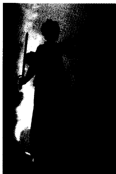
Apotheker Dietmar Frensemeyer setzt seinen juristischen Kampf gegen die ABDA fort. Beim Deutschen Apothekerverlag findet er zumindest partiellen publizistischen Beistand. Seite 8

Frensemeyer: Apothekerkammer soll zum Austritt aus der ABDA gezwungen werden