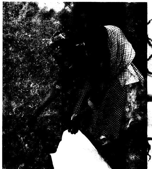
Viele pflanzliche Präparate weisen eine lange therapeutische Tradition auf. Wie sie jedoch wirken, ist meist noch unklar. Erste molekularbiologische Ergebnisse gibt es nun für den unter dem Namen Umkalooabo bekannten Extrakt der Geraniaceae Pelargonium sidoides. Seite 26