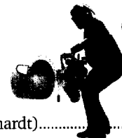
Gute alte Zeit: Einfügen einer Restriktions-Schnittstelle