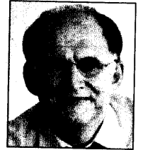
Bundesdatenschutzbeauftragter Peter Schaar.

BERLIN (ger). Der Bundestag hat am Freitag Peter Schaar zum neuen Bundesbeauftragten für den Datenschutz gewählt. Im Gespräch mit der „Ärzte Zeitung“ setzte sich Schaar dafür ein, daß die Ärztekammern Verhaltensregeln für Ärzte entwickeln, die ins Internet gehen, um so die Risiken für die Patientendaten auf den Praxisrechnern möglichst gering zu halten. Schaar wird Joachim Jacob ablösen, der zehn Jahre im Amt gewesen ist. Siehe auch Seite 4