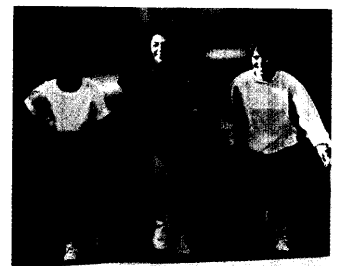
Auf Dauer fit und schlank. Schon moderate Bewegung bringt's, wie eine US-Studie nun zeigte.