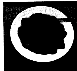
Fettarme Kost: Schützt sie vor einer koronaren Herzkrankheit, aber nicht vor einem Schlaganfall?