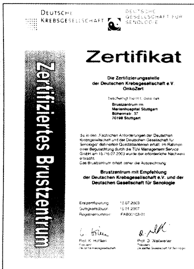
Qualitätssiegel „Zertifiziertes Brustzentrum“