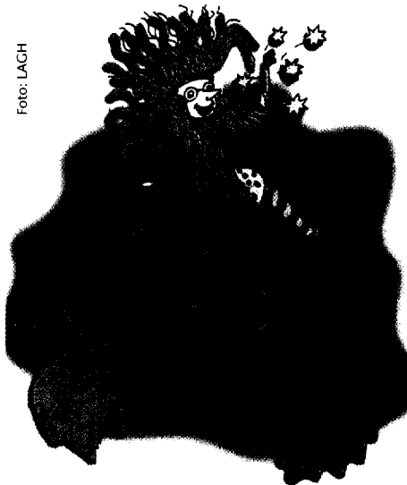
Halloween lädt ein mit zahngesunden Hexenrezepten und schreiend lustigen Ideen.