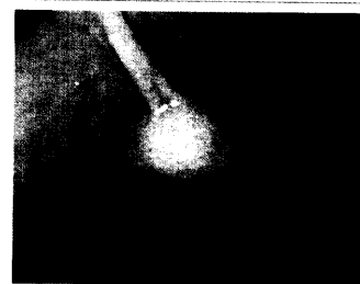
Intraluminaler GIST des Magens.