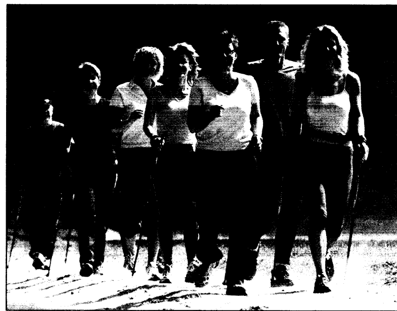
Ob mit oder ohne Stöcke: Walking ist ein Ausdauersport, der von Sportärz-