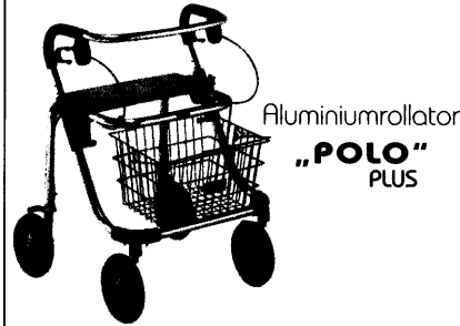
Aluminiumrollator „POLO“ PLUS