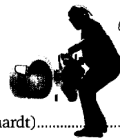
Gute alte Zeit: Einfügen einer Restriktions-Schnittstelle