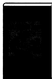
Spitzer Musik im Kopf Hören, Musizieren, Verstehen und Erleben im neuronalen Netzwerk 2002. 480 S., 146 Abb., geb. € 32,95/CHF 52,70 ISBN 3-7945-2174-9